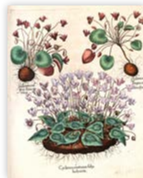
Herbst-Alpenveilchen Abb. Hortus Eystettensis, Tafel 348 von Basilius Besler, um 1613

Im Jahr 1600 beauftragte der Fürstbischof den Nürnberger Apotheker und Botaniker Basilius Besler, diese Pflanzen wissenschaftlich zu kategorisieren und in einem Buch festzuhalten. So erschien 1613 der „Hortus Eystettensis“ : ein Prachtband mit 367 Kupferstichtafeln , auf denen 1084 Pflanzen dargestellt werden. Er gilt bis heute als eines der großartigsten Werke botanischer Buchillustration.